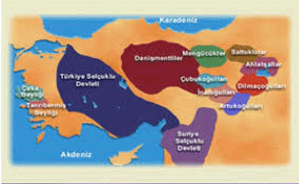
I.Beylikler Dönemi Beylikler haritası

Dönemin önemli beylikleri ve devletleri, Haçlı Seferleri'ne karşı çeşitli stratejiler ve önlemler almış, aynı zamanda kendi iç durumlarını güçlendirmek için bir dizi reform gerçekleştirmiştir. Bu beyliklerin ve devletlerin, Haçlı Seferleri'nin etkileri altında gelişen sosyal, kültürel, ekonomik ve siyasi durumları, dönemin dinamiklerini daha iyi anlamak açısından kritik öneme sahiptir. Haçlı Seferleri'nin başlangıcıyla birlikte, bölgedeki Türk beylikleri ve İslam devletleri, Batı Avrupa'dan gelen tehditlere karşı savunma pozisyonu alırken, aynı zamanda iç yönetimlerini de güçlendirmeye yönelik adımlar atmışlardır.