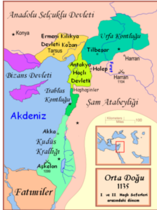
(I.Haçlı seferleri sonrası kurulan krallıklar)

Maddî yardımların etkisiyle şehrin surlarına yapılan saldırılar sıklaştı. Fakat askerî birlikler etkili taarruzlar yapamıyorlardı. Bu sebeple Haçlı liderleri, askerlerin morallerini üst düzeyde tutabilmek için Antakya'da etkili olduğu ispatlanmış dinî coşkuyu Kudüs'ün surları etrafında da canlandırdılar. Bu dinî coşkuya sebep olan olay Antakya'daki kutsal mızrak hikayesinden biraz farklıydı fakat iddiaya göre oluşturduğu motivasyon imkânsızlıklar içindeki Haçlıları tahrik etmeye yetti. Söylentilere göre Antakya'da ölmüş Adhemar ordu içerisinde görüldü ve Kudüs'ü alacaklarına dair müjdeli haberler verdi. Haçlılar varlığı meçhul bu müjdecinin getirdiği haberlerin tesiriyle aralarındaki ihtilafı ve anlaşmazlıkları bir kenara koyarak şehrin ele geçirilmesinden kısa bir süre öncesinde geçici bir ittifak kurmayı başardılar. Tüm bunların sonucunda 15 Temmuz'daki saldırıda Haçlı ordusu başarılı oldu. Godefroi de Bouillon birliklerine bağlı Tournaili iki savaşçı ahşap bir kuşatma kalesi arasından sıçrayarak duvarlara bir dayanak sağlamayı başarıp Haçlıların şehre girebileceği bir yol açtı ve şehir Haçlıların eline geçmiş oldu