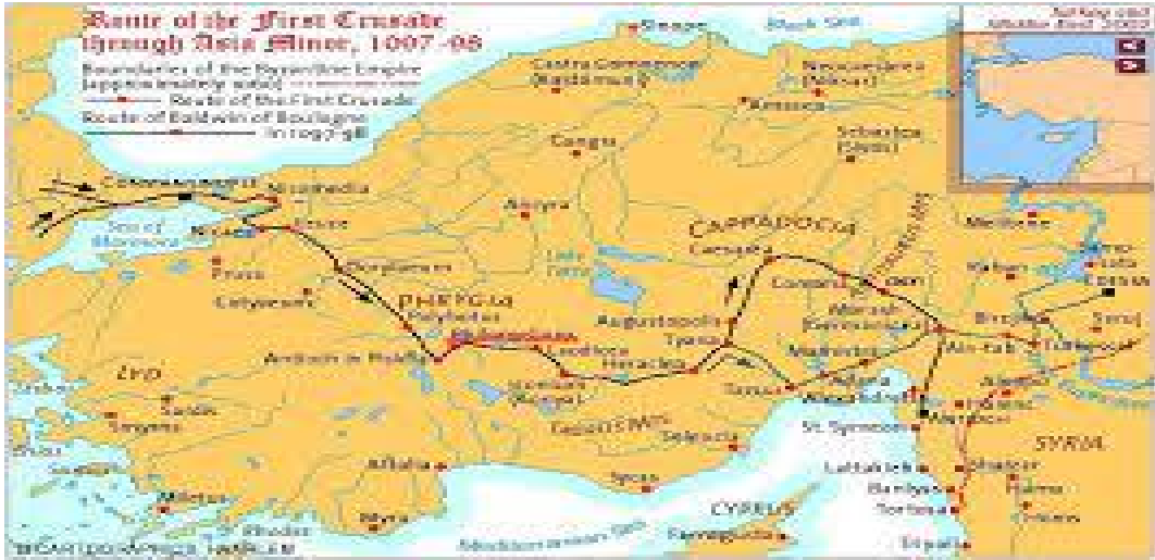
(Haçlı ordusunun Güzergahı)

Çukurova civarında bir devlet kurmanın imparatorluk tarafından hoş karşılanmayacağını ve bu davranışın Bizans'a karşı bir meydan okuma olabileceğinin farkında olduğundan Maraş yakınlarında birleştiği ana Haçlı ordusundan daha önce de yaptığı gibi ayrıldı ve daha Doğu'ya doğru uzaklaştı. Tankred ise Baudouin'nin aksine Çukurova bölgesinde bir yer edinme hayalini sürdürmekteydi. Baudouin ve Tankred'in Kilikya bölgesi üzerinden ilerleyişlerini sürdürüp Ermeniler ile iletişime geçme sebepleri günümüz tarihçileri tarafından farklı şekillerde değerlendirilmiştir. Tarihçilerin bir kısmı bu girişimi tamamen plânlı bir organizasyonun parçası olarak görürken diğer kısmı şartların gerektirdiği bir gelişme olarak görmüşlerdir. Bu hususlar aşağıda Antakya kuşatması öncesi yaşanan olayların anlatıldığı kısımda ayrıntılarıyla tartışılacaktır.