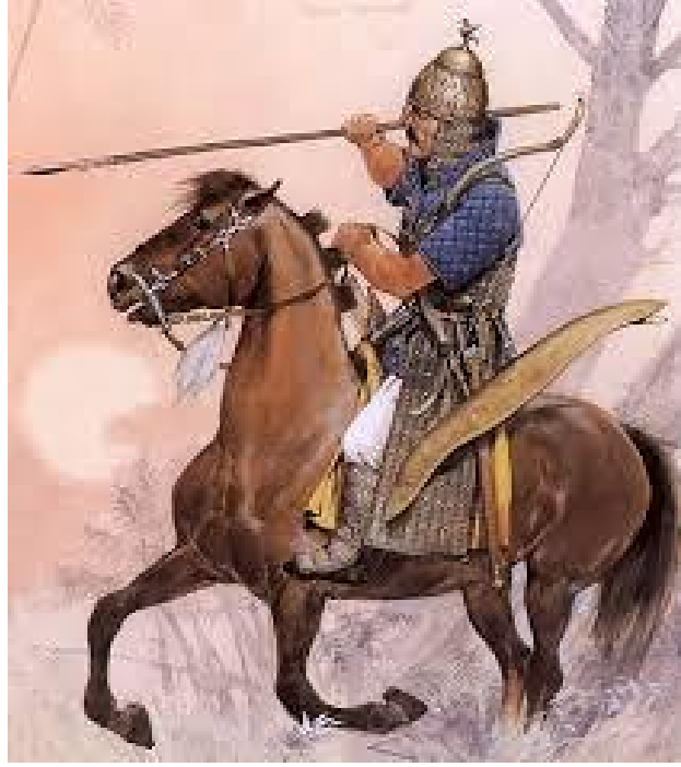
(I.Haçlı seferleri sırasında Türk ve Bizans Süvarileri)